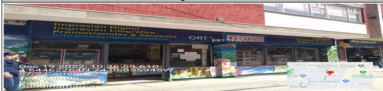
Fotografía No. 4

Fachada con orientación visual hacia la CL 57, en la que se puede evidenciar: un (1) elemento publicitario adicional con relación al único permitido por fachada de establecimiento, incorporado en la ventana identificado con el número 1.